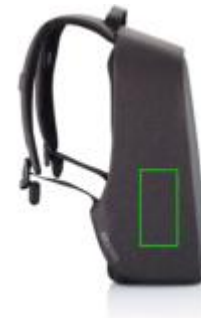
Artikel linke Seite unten