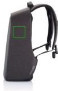
Artikel rechte Seite oben