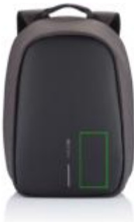
Artikel Vorderseite rechts