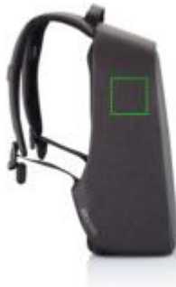
Artikel linke Seite oben