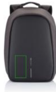
Artikel Vorderseite links