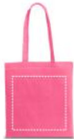
Beutel - Vorderseite