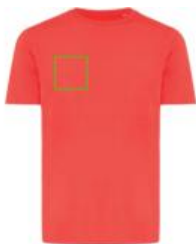
Brust Vorderseite rechts