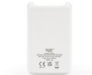
Powerbank - Rückseite