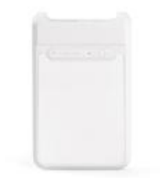
Powerbank - Vorderseite